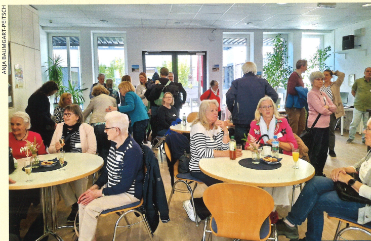
Viele Gäste waren zur 65-Jahr-Feier des Trägervereins des Nachbarschaftshauses Wiesbaden gekommen.